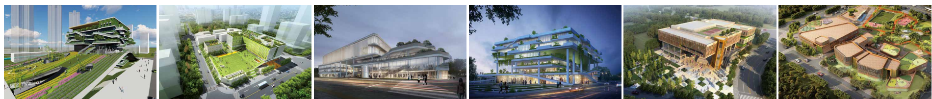
▲获奖作品“梦花园”(6号邻里中心) ▲1号邻里中心 ▲2号邻里中心 ▲3号邻里中心 ▲4号邻里中心 ▲8号邻里中心

新川园区内8个邻里中心的设计各具特色，其中2017年“新川杯”四川省第二届绿色建筑创意竞赛“邻里中心”设计一等奖的“梦花园”方案以“漂浮式设计”将邻里中心的建筑主体置于“空中”，而将主体之下的空间让给城市公园，从而使城市公园的面积得以成倍的延伸，将节约的土地反哺给城市，提供给市民最大化的活动空间。邻里中心将于今年启动建设，预计在2020年全面完成。