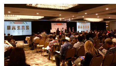
▲2018 CABS BioPacific 会议现场

2018年6月23-26日, 新川受邀参加在美国加州举办的2018 CABS BioPacific 会议, 与旧金山湾区生物医药领域的企业高管进行深入交流。新川美国招商团队积极参与座谈讨论, 向参会者进一步推广成都、成都高新区以及新川园区。此次会议中, 新川共与23家参会企业进行沟通交流, 与5家目标企业建立了持续性联系。