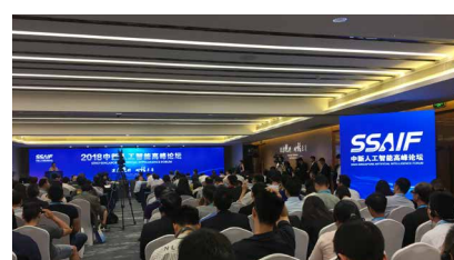
▲2018中新人工智能高峰论坛 (2018 SSAIF)

学习, 收获了行业前沿讯息及值得借鉴的宝贵办会经验。新川计划在恰当时机主办此类高水准的行业盛会, 搭建有价值的交流平台, 探寻更专业精准的品牌推广、企业宣传形式, 更好地促进成都高新区、新川园区的产业发展。