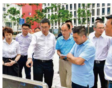
▲余辉主任现场考察新一代信息园

5月29日，成都高新区党工委副书记、管委会主任余辉前往新川创新科技园进行实地调研并召开新川创新科技园工作专题会。